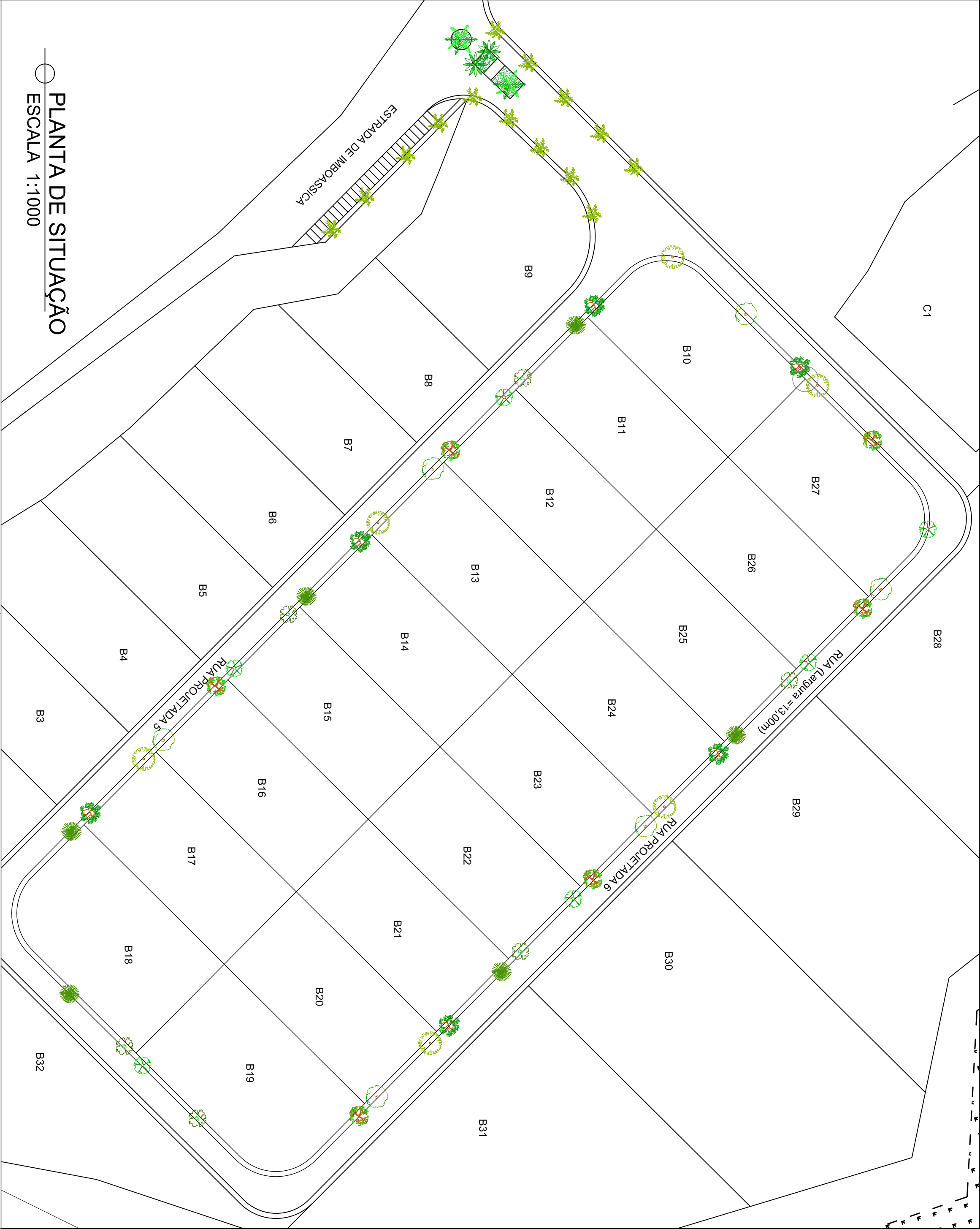
PLANTA DE SITUAÇÃO